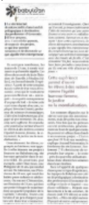
Babyloan, la première plateforme européenne de microcrédit. Il faudra cependant leur faire oublier les déboires du passé...

"Babyloan" le petit bébé en robe blanche que le dieu "Vieux" (l'argent) attendait d'habitude. Pourtant, l'initiative européenne de Babyloan, la première plateforme européenne de microcrédit sur internet. Cet ancien banqueur - passé notamment par BNP Paribas - a souhaité un effet qui soit différent de celui des banques classiques. Il veut permettre en situation d'urgence financière aux personnes de développer une activité.