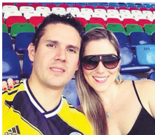
@natalialr26 Nuestra Cali, capital deportiva del mundo, siempre se luce. Excelente evento #WYC #DeCaliSeHablaBien /