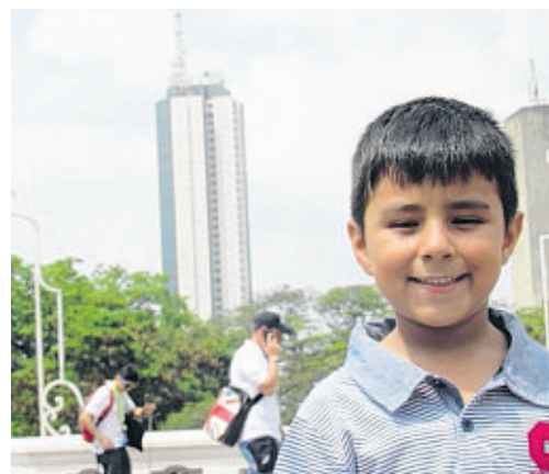
@yoapellidos31 #DeCaliSeHablaBien cuando los más chiquitos de la familia se dan cuenta cuanto de hermosa es su ciudad /