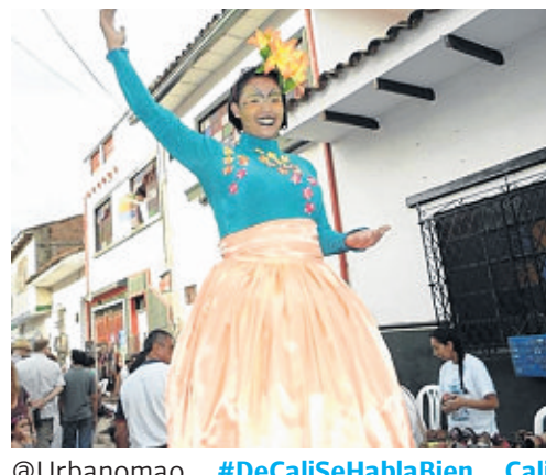
@Urbanomao #DeCaliSeHablaBien Cali enamora, enamora su noche, su día, sus calles y sus mujeres. por eso es la capital del cielo /