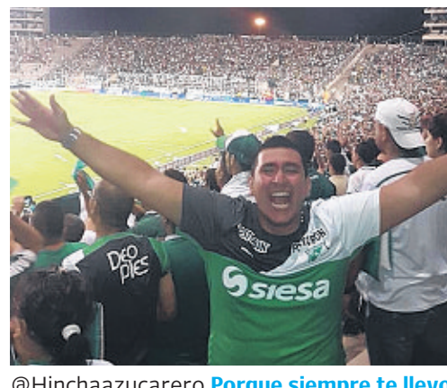
@Hinchaazucarero Porque siempre te llevo en mi corazón y representas nuestra ciudad y nuestra región #DeCaliSeHablaBien #VamosCali /

Comparte tus razones en: www.decalisehablabien.com #DeCaliSeHablaBien